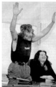
La strana coppia

Un ossimoro vivente, e dopo un'orazione civile, ci sta questa bestemmia laica: in questo Vajont alla rovescia il Fenomeno pantomima e delizia (riuscendoci) la Presidente dell'Ass. Cul.. A un solo tavolo, felici ed uniti per un progetto grottesco ed esiziale la "paladina virtuale" della povera Merlin e un parvenu , vile scriba (per lucro) delle mafie contro cui Merlin combatté (sola) scrivendo: